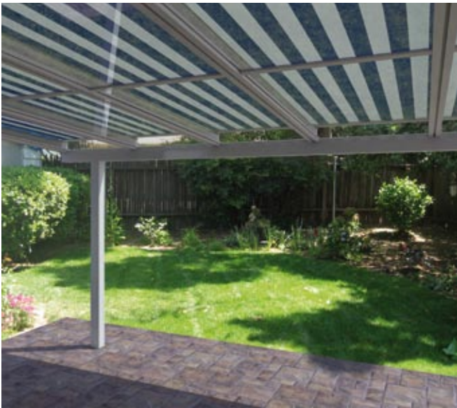
Mit der integrierten Aufdachmarkise wird das Glasdach auch zum Schattenspender.

Das Ludwigscluster Unternehmen Lewens Sonnenschutz-Systeme befindet sich weiter auf Expansionskurs. Nicht nur beim Umsatz konnte der Hersteller von hochwertigen Markisen in 2011 kräftig zulegen. Auch die Produktionsfläche wurde erweitert, die Mitarbeiterzahl stieg und die Corporate Identity erhielt ein neues Outfit.