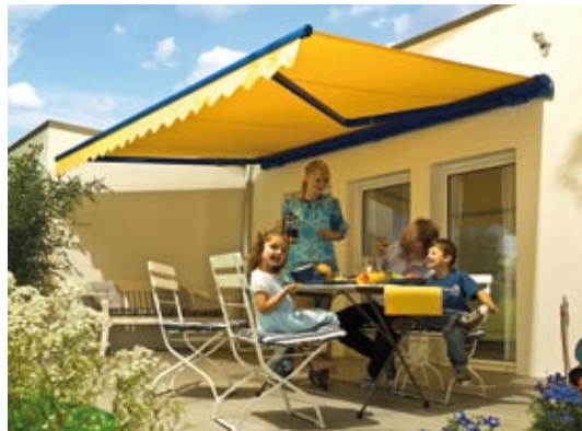
Dank eigener Pulverbeschichtung können die Markisen und Glasdächer in jeder gewünschten Farbe geliefert werden.